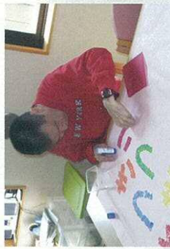
〈さつき藤野工房〉の3つの理念

いろいろな障害に応じた対応に努め、わかりやすい言葉、必要なコミュニケーションを支援し、見守りをします。